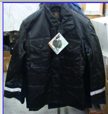
M65 Field jacket MPTex Pompiere